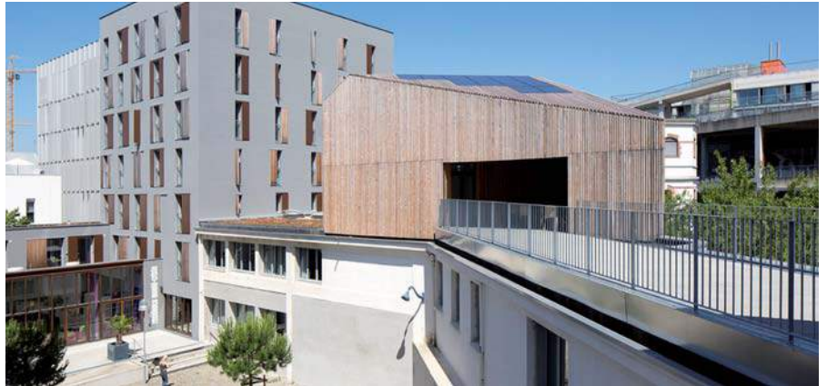
La densification du bâtiment participe à sa performance. Deux ajouts ont été réalisés sur le bâtiment existant. Leur toiture supporte les capteurs solaires photovoltaïques.

Cette approche tous usages nécessite d'avoir un regard vigilant sur les consommations électro-bureautiques. Pour optimiser le fonctionnement du bâtiment, une centrale d'acquisition des données et de pilotage de l'installation a été développée sur mesure avec Schneider Electric et l'intégrateur Ouest Domotique. Les premiers retours sur les consommations et la production réelles sont attendus au bout d'un an d'exploitation, fin 2015.