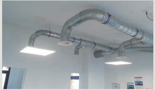
La diffusion de chaleur est assurée par l'air, complété par quelques radiateurs à chaleur douce (basse température). La ventilation double flux Everest d'Aldes souffle de l'air neuf modulé en fonction du taux de CO 2 détecté. Les gaines de ventilation ont été laissées visibles à l'intérieur.

la partie autoconsommation. Il permet de lisser la charge par stockage temporaire pour avoir quasiment 500 W injectés dans le bâtiment en permanence (CTA et vélos).